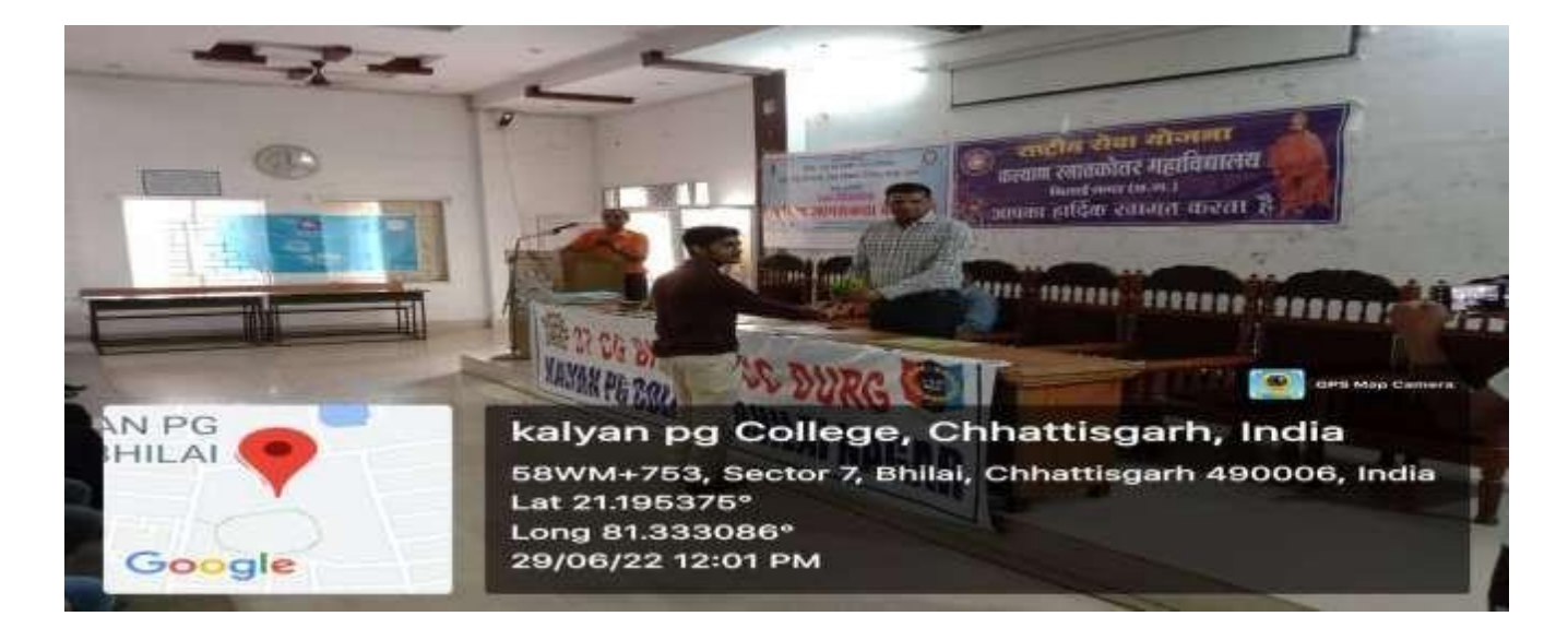
PRINCIPAL Katyan Post Graduate Oofleg Bhilai Nagar (C.G.)

Report : In the occasion of National Awareness on Unity we organized 'Ek Diwasiya Rastriya Jagrukta Karyakram' in our college and we motivated all students about the strength of unity.