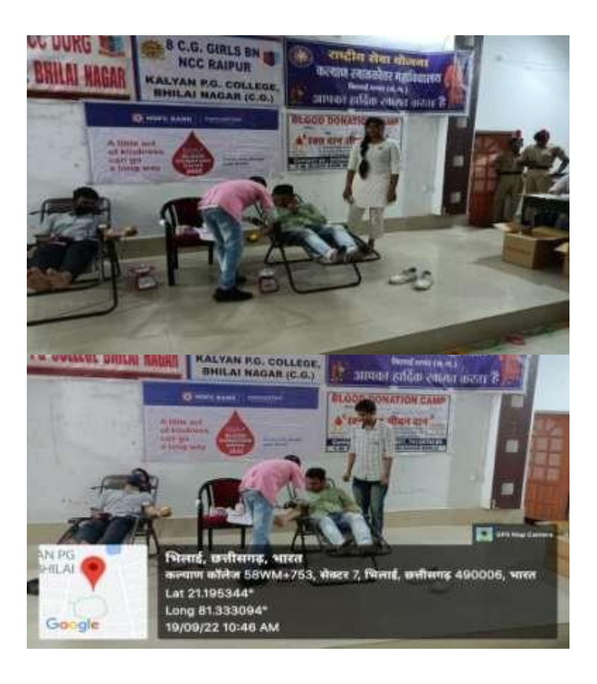
PRINCIPAL Kalyań Post Graduate Coflogr Bhilai Negar (C.G.)